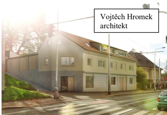
Vojtěch Hromek architekt

Ve čtvrtek 20. března se farnosti představí čtyři návrhy různých architektonických ateliérů, které si můžete podrobně prohlédnout také na webových stránkách farnosti. Zde vybíráme z každého