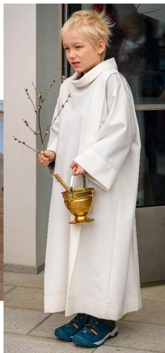
Liturgie Květné neděle Velikonoční příběh pro rodiny Velikonoční katecheze pro maminky s dětmi v azylovém domě Gloria Křížová cesta pro děti