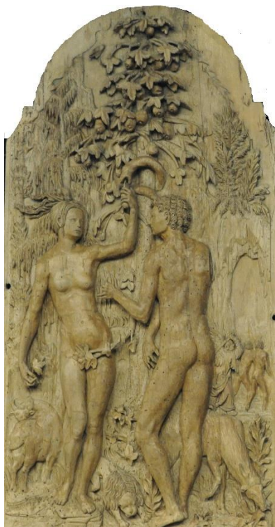
Okruh Mistra IP (Mistra zlíčovského oltáře), Vyhnání z Ráje , Liebieghaus, Frankfurt

vašich skutcích. Myslíte si, že si postem můžete něco zasloužit? Naopak, zkazíte i to málo dobrého, co ve vás je. Obracíte se proti přirozenosti, kterou do vás vložil Bůh. Jíst je dobré, spát je dobré, radovat se je dobré. Přirozenost nesmíte násilím potlačovat, musíte ji tak nějak produchovnit.“ Eva odříkala otčenáš a naložila sobě i manželovi pěknou porci vepřového... (srv. Gn 3, 1-6)